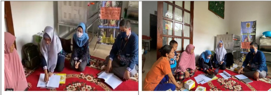
Gambar 2. Foto Kegiatan penyuluhan perpajakan dan simulasi pengisian SPT Tahunan 1770

Tim PKM pada sesi ini memberikan ilustrasi proses pencatatan penjualan dan biaya harian, rekapitulasi penjualan dan biaya setiap bulan. Berdasarkan data penjualan dan biaya per bulan dilakukan perhitungan pembebanan biaya produksi per unit. Biaya produksi per unit digunakan untuk mencatat harga pokok penjualan, dan perhitungan laba bruto setiap bulan[7]. Data penjualan bulanan dan laporan perhitungan laba rugi tersebut digunakan untuk melengkapi pengisian SPT Tahunan 1770. Pada akhir sesi ini mitra menyatakan ilustrasi pembukuan tersebut sangat bermanfaat dan akan berusaha tertib administrasi pembukuan karena digunakan untuk lampiran SPT Tahunan.