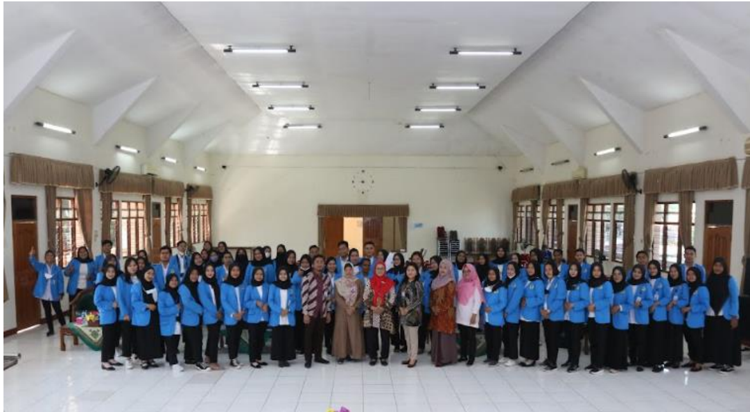
Gambar 3. Foto bersama setelah Pelatihan

bisnis tetapi juga cara mempraktikkannya secara langsung menggunakan teknologi mutakhir.