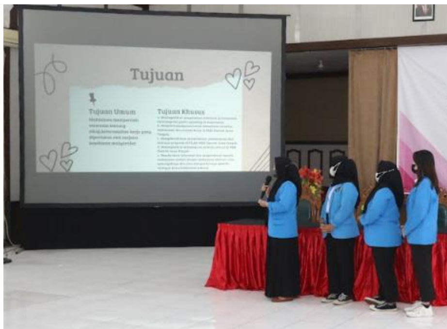
Gambar 2. Ceramah dan Diskusi Hasil Proposal Business Plan

Feedback dari peserta menunjukkan bahwa 85% mahasiswa merasa pelatihan ini relevan dan bermanfaat bagi kebutuhan mereka sebagai mahasiswa bisnis digital. Beberapa peserta juga merekomendasikan agar pelatihan serupa dilakukan untuk topik lain, seperti pengembangan strategi pemasaran digital berbasis AI.