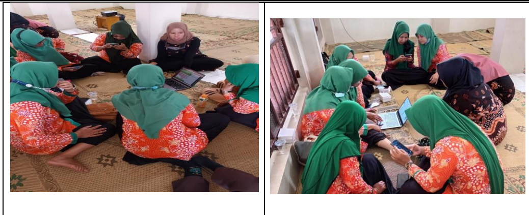
Gambar 2. Praktek Pembuatan Worksheet Bersama Kelompok Kecil