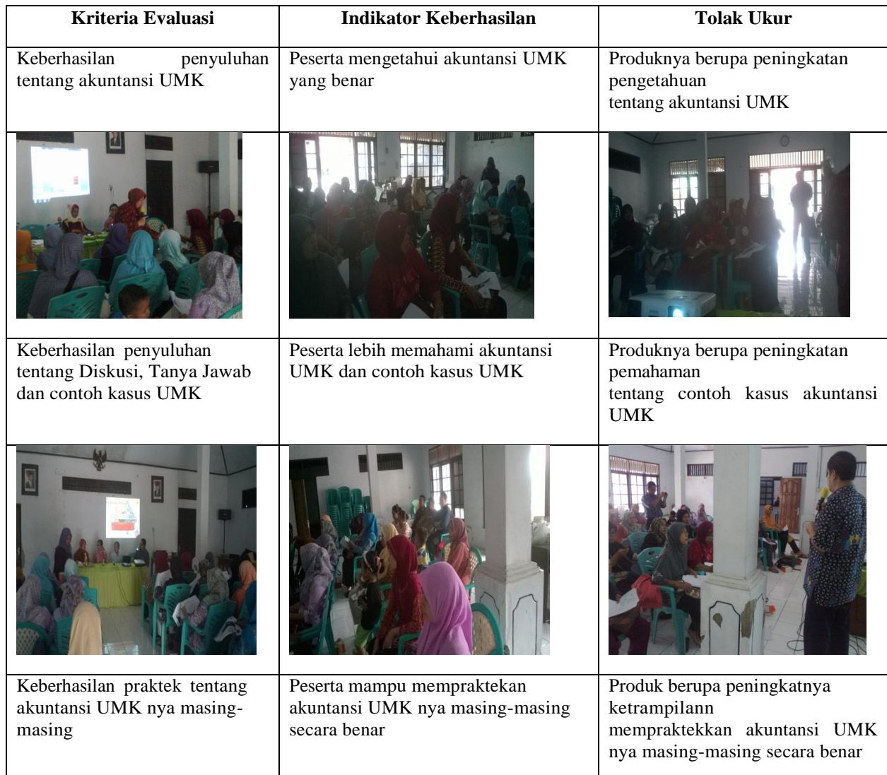
Tabel 1. Kriteria, Indikator dan Tolak Ukur Keberhasilan PKM

berdasarkan apa adanya. Pembukuan usaha terutama dalam hal manajemen kas belum dilakukan dengan sistematis sehingga tidak diketahui perkembangan usahanya. Dengan demikian kegagalan-kegagalan masih sering dialami dan usaha UMK belum optimal.