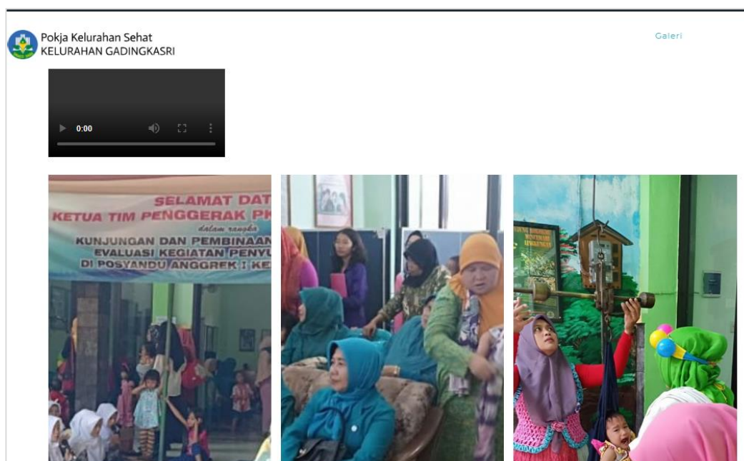
Gambar 5. Galeri berisi kumpulan dokumentasi kegiatan pokja sehat serta panduan-panduan praktek kesehatan