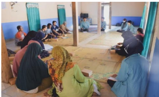
Gambar 1 Sosialisasi Pengenalan Program Kegiatan

Pemanfaatan limbah minyak jelantah menjadi produk lilin aromaterapi merupakan hal baru bagi warga Dukuh Pojok. Eksistensi lilin konvensional lebih tinggi karena penggunaannya lebih sering daripada lilin aromaterapi. Pada sosialisasi awal ini, disampaikan kepada warga terkait inovasi baru yang memiliki nilai jual dengan menggunakan bahan-bahan berbasis eco friendly untuk menunjang rintisan desa kreatif. Warga memberikan dukungan positif terkait inovasi yang telah disampaikan.