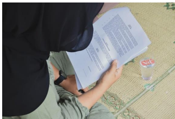
Gambar 8. Penyusunan Perjanjian Kerja Sama (PKS)

Pembentukan Perjanjian Kerja Sama (PKS) dilaksanakan pada tanggal 23 November 2023. Pembentukan perjanjian kerja sama dengan tim produksi merupakan langkah penting dalam mengatur kerjasama antara pihak-pihak yang terlibat dalam proses produksi. Proses ini dimulai dengan pembahasan antara manajemen perusahaan dan anggota tim produksi untuk mengidentifikasi tujuan bersama, ruang lingkup proyek, tanggung jawab masing-masing pihak, serta keberlanjutan usaha.