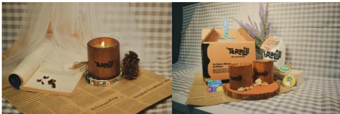
Gambar 10. Contoh Packaging Produk Teralili

Pemasaran lilin aromaterapi dari minyak jelantah dilakukan melalui berbagai media pemasaran yang beragam untuk mencapai audiens yang lebih luas. Kombinasi dari media pemasaran daring dan offline menjadi strategi yang efektif dalam memperkenalkan dan memasarkan lilin aromaterapi dari minyak jelantah ini kepada konsumen potensial, sambil mempromosikan kesadaran lingkungan dan keberlanjutan.