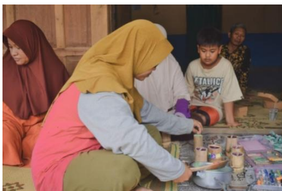
Gambar 3. Sosialisai Pembuatan Lilin Aromaterapi

Lilin aromaterapi dibuat menggunakan minyak jelantah sebagai bahan utama. Pembekuan minyak menjadi padat diperlukan bubuk stearic . Bubuk stearic adalah bahan yang dihasilkan dari proses pemurnian stearic yang merupakan salah satu unsur lemak nabati atau hewani yang dapat ditemukan di dalam lemak. Sifat lemak yang dapat memadat dalam suhu rendah disebabkan oleh stearic . Maka dari itu, untuk memadatkan minyak jelantah menjadi lilin adalah dengan mencampurnya dengan bubuk stearic . Bubuk stearic akan meleleh dalam suhu tinggi. Meletakkan mangkuk ke dalam air yang di dalam panci. Panas air akan dihantarkan oleh mangkuk yang kemudian akan melelehkan stearin dan minyak sehingga kedua zat tersebut akan bercampur, lalu diaduk. Tuangkan minyak aromaterapi ke dalam campuran tersebut dengan perbandingan 3:5:5, atau disesuaikan dengan keinginan.