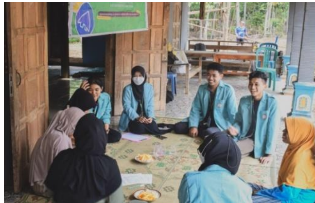
Gambar 5. Workshop Pemasaran