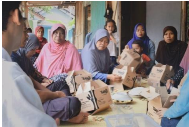
Gambar 4. Workshop Packaging