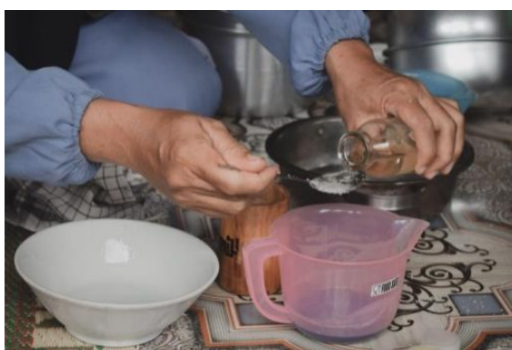
Gambar 9. Pelatihan dan Pendampingan Proses Pembuatan Produk Lilin Aromaterapi

Pelatihan dan pendampingan dalam proses produksi lilin aromaterapi dari minyak jelantah menghadirkan suatu kesempatan yang komprehensif bagi tim produksi untuk memahami dan menguasai seluruh tahapan produksi, mulai dari pengolahan minyak jelantah hingga penyusunan produk akhir. Proses dimulai dengan pemahaman mendalam mengenai sumber daya bahan baku, di mana peserta akan belajar tentang berbagai jenis minyak jelantah yang dapat digunakan dan cara-cara untuk membersihkan serta menyulingnya agar menjadi bahan dasar lilin yang berkualitas. Selain itu, pelatihan ini juga mencakup pengenalan terhadap berbagai macam minyak esensial atau aromaterapi yang dapat digunakan untuk memberikan aroma pada lilin, mulai dari minyak lavender yang menenangkan, hingga greentea yang menyegarkan.