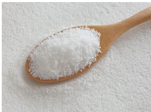
Gambar 2. Stearic Acid

Tuang minyak ke dalam mangkuk terpisah, kemudian campur dengan stearic dengan perbandingan 1:1 lalu aduk.