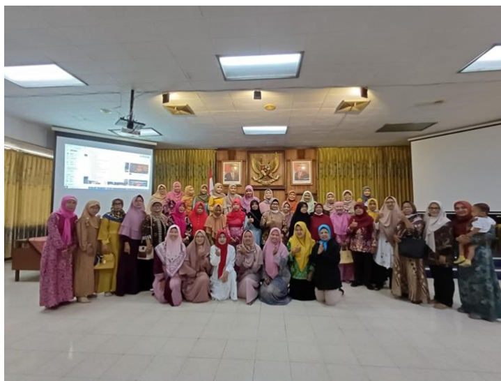
Gambar 3. Foto bersama di akhir sesi kegiatan

Beberapa capaian yang diperoleh dan juga rencana lanjut dari kegiatan pengabdian ini diantaranya: