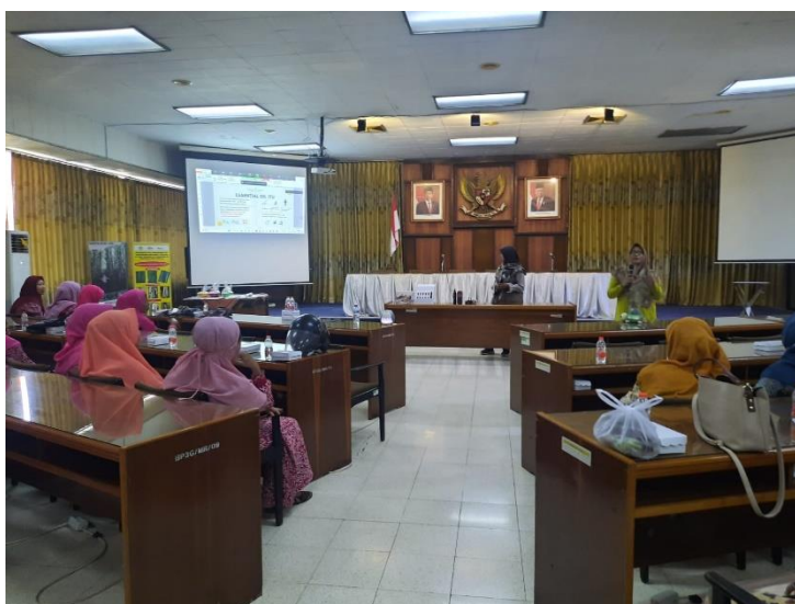
Gambar 1. Pemaparan Materi

Pihak mitra yaitu para ibu rumah tangga, istri karyawan salah satu Perusahaan milik negara di Kota Pasuruan merasa sangat senang dan terkesan dengan kegiatan ini yang berupaya mengenalkan IPTEK dalam meningkatkan pemanfaatan literasi digital melalui penggunaan android (smartphone) di kalangan para ibu rumah tangga.